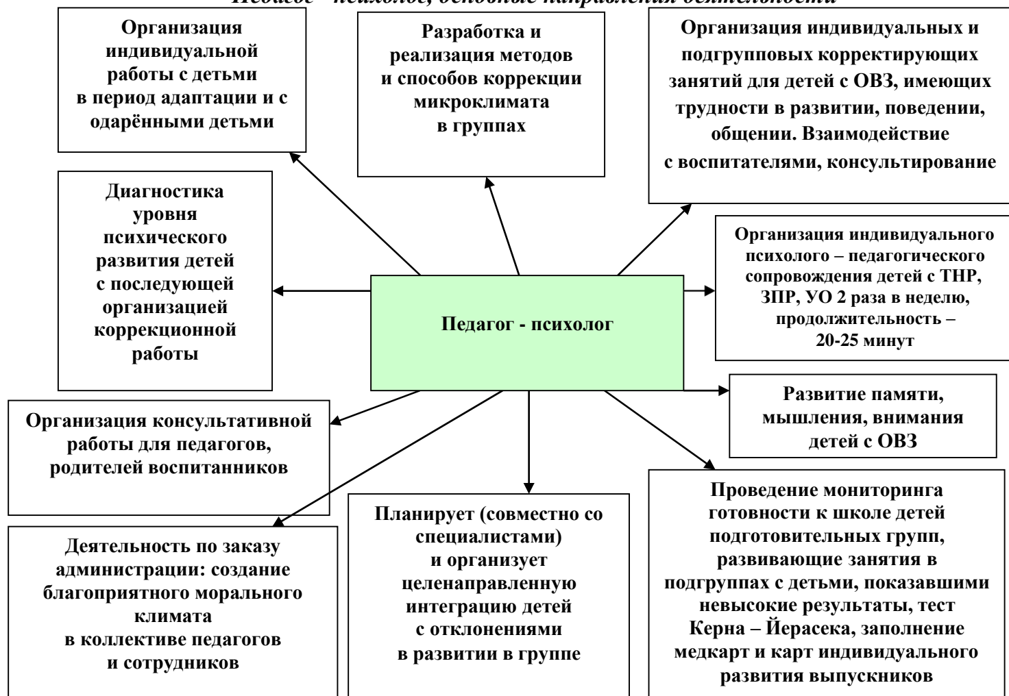
Рис. 2 «Педагог - психолог, основные направления деятельности»